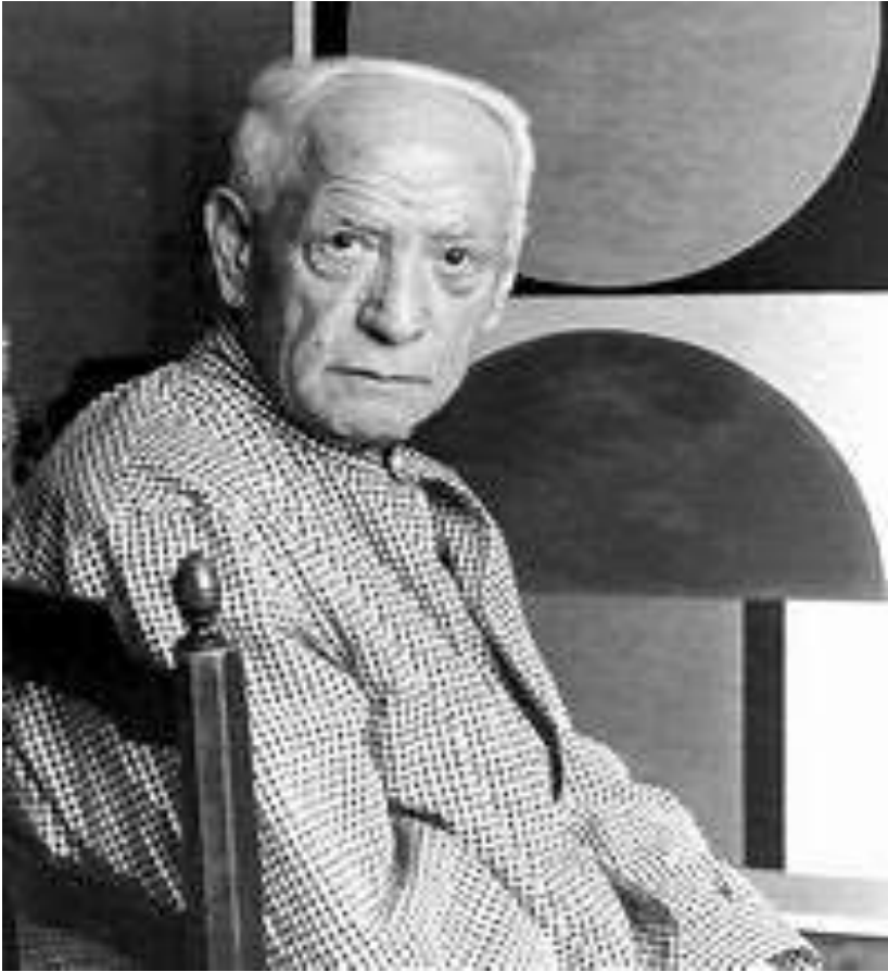
Auguste Herbin (1882-1960)