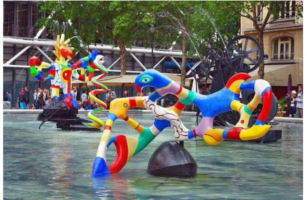
Niki de Saint Phalle et La fontaine Stravinsky