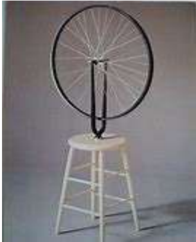
Ready-made de Marcel Duchamp