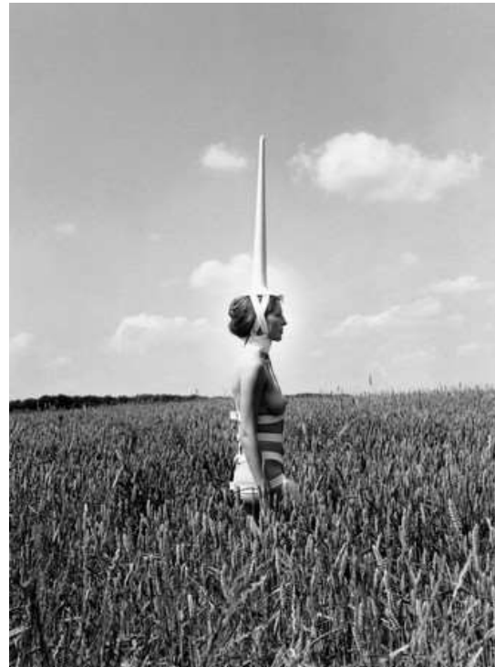
Unicorne (1970) Performance