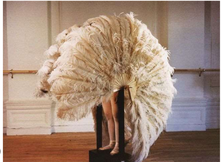
La douce prisonnière (1978)

https://www.youtube.com/watch?v=v3DfebecTcQ