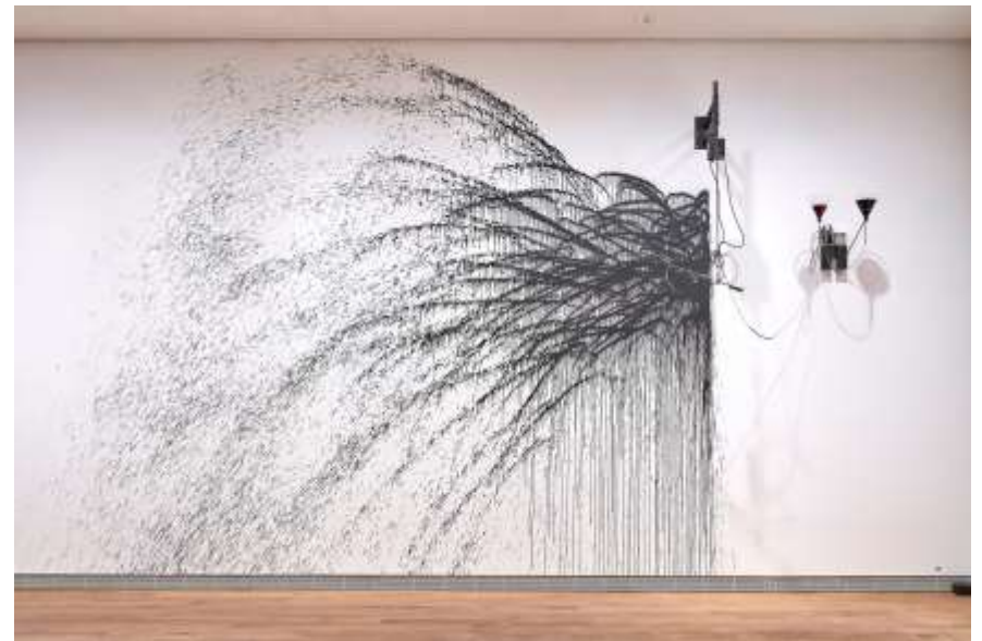
Les Amants, 1991, Installation Galerie de France