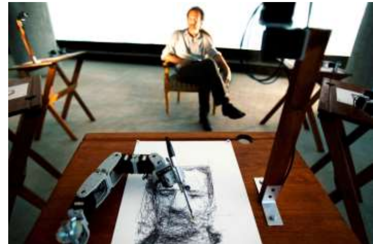
Dessin de Tresset