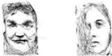
Dessin d'une de « Paul »